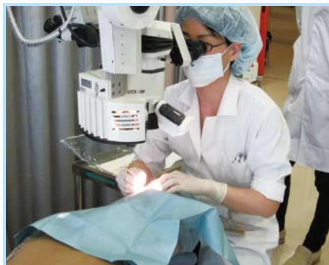
加齢黄斑変性に対する抗血管内皮増殖因子(VEGF)剤の硝子体内注射

当ユニットが東京女子医科大学病院のみならず、日本、ひいては世界の黄斑疾患診療のメッカとなれるよう、スタッフ一丸となって努力致す所存です。是非とも多くの患者さんのご紹介を賜れますよう、何卒宜しくお願い申し上げます。