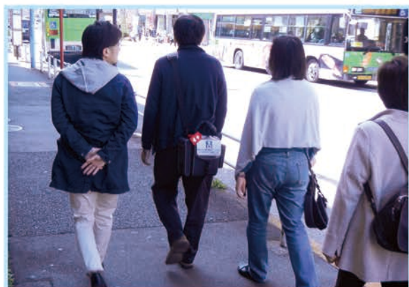
病院外トレーニングの様子