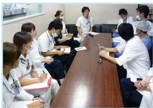
VAD 退院調整多職種カンファレンス

2011年から末期重症心不全患者は補助人工心臓(以下、VAD)を装着して退院することが可能となりQOLの向上が期待されています。一方で、VAD植込み患者は生命維持装置とも言える医療機器と共に常時生活する必要があるため、退院後も、機器管理が安全・確実にできるか、合併症の予防管理が適切にできるか、社会との関係を再構築できるか等、さまざまな不安や葛藤を抱えます。そこで、退院支援プログラムを作成し、在宅に安心して帰れるよう支援しています。また、在宅療養支援体制整備の一環として、「VAD看護専門外来」を開設しました。現在は、患者・家族ケアを中心に、病棟と外来のケアに関する連携の橋渡しや、医師・看護師・臨床工学技士など多職種の連携の窓口となっています。