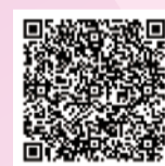
東京女子医大理系女子 HP