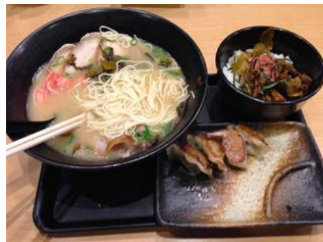
長浜ラーメン・高菜明太飯