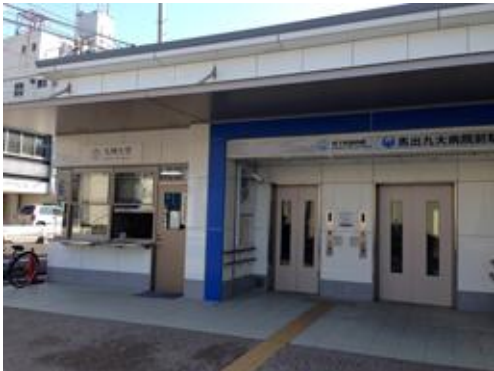
九大構内守衛室横 市営地下鉄駅入口