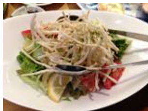
細切りゴボウ揚げ