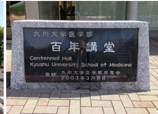
九州大学医学部百年講堂 礎石