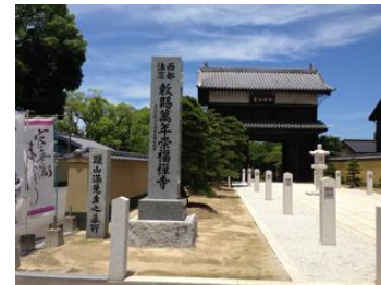
黒田家墓地と隣接 堀越し崇福寺