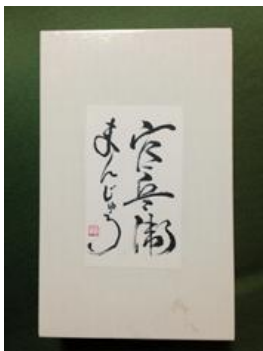
官兵衛饅頭@崇福寺