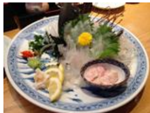
カワハギ活き造り