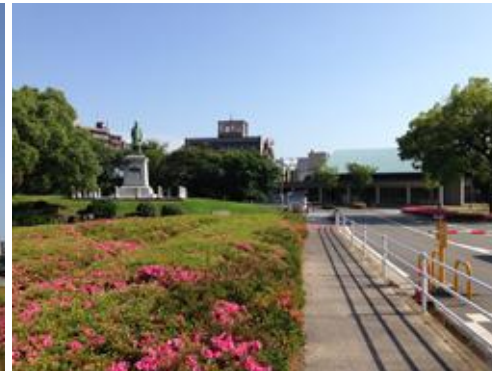
九州大学医学部百年講堂 遠景