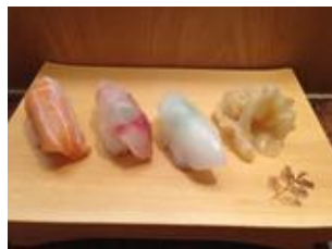
生鮭・喉黒・烏賊