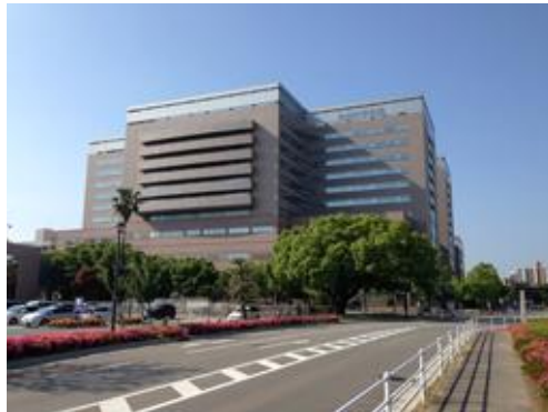
九州大学医学部附属病院