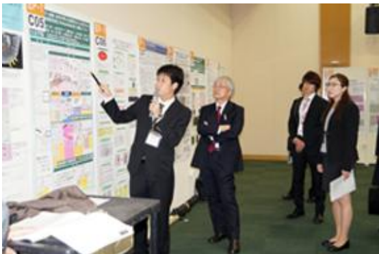
ポスターセッション 1演題前