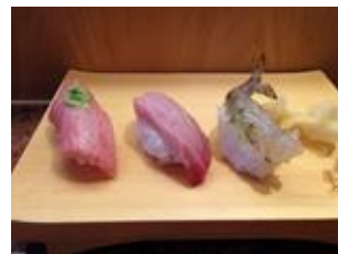
近海印度鮭・海老