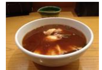
皮剥味噌仕立てアラ汁