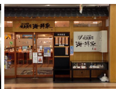
新潟駅『海鮮屋』寿司