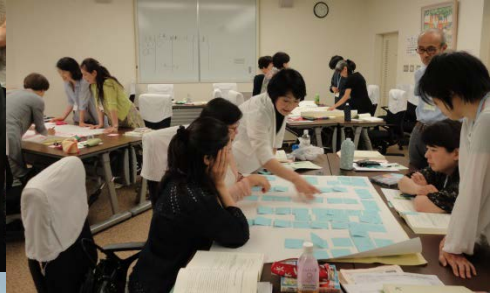
子どもの心の発達と 保育者の関わり

第8期保育サービス講習会には女子医大の保護者の方も含め18名が参加。全課程を修了されたのは11名。多趣味な方が多く保育以外の情報も豊かで充実した意識の高い講習会でした。