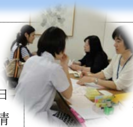
▲説明会での登録の様子 ▼7月16日の全体説明会