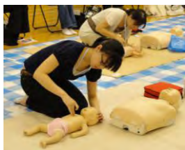
◀「普通救命講習」 牛込消防署にて