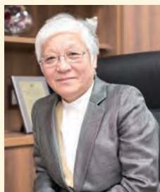
女性医療人キャリア形成センター長