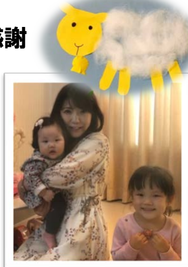
▲子ども達と作ったふわふわ羊

提供会員さんは優しく柔らかい雰囲気の方で、とても安心しました。次女は絵本を読んで頂いたり、歌を歌って頂いたり穏やかな時間を過ごせたようです。ふたり預けた際にはスーツケース一杯に遊び道具を用意して来ていただきました。子ども達は勿論、私にとっても素晴らしい出会いを頂戴し感謝しております。