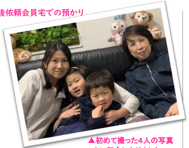
▲初めて撮った4人の写真 よい記念になりました。

今回私事によりファミリーサポートを退会することとなりましたが、4年間を経た今の私にとって仕事と育児の両立を何とか実践できていることが、私の誇りであり、エネルギーの源になっております。このように考えられるのもすべてファミリーサポートの皆様のご支援・ご厚情であり、感謝の念に堪えません。本当にありがとうございました。