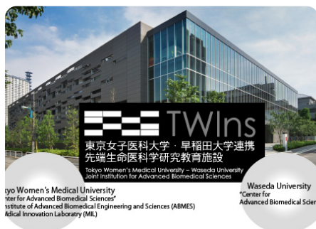
医工融合研究施設「TWIns」