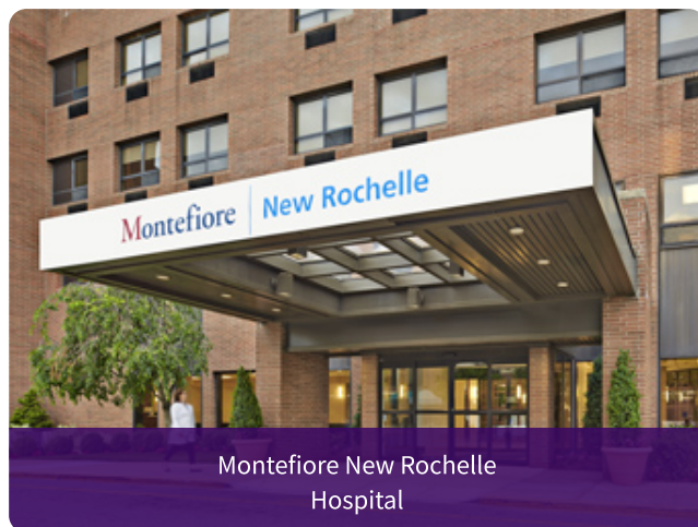
Montefiore New Rochelle Hospital

特に外傷外科・外科系救急を目指す方には、海外臨床留学を強く推奨しています。センター長自身の米国Level Iトラウマセンターでの指導医経験を活かし、 USMLE取得から留学先の斡旋、ECFMG certificate取得支援 まで全面的にバックアップします。