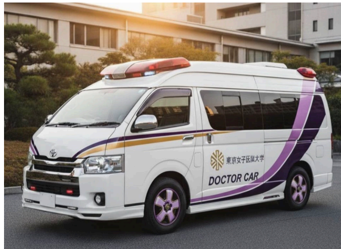
導入予定車両デザイン