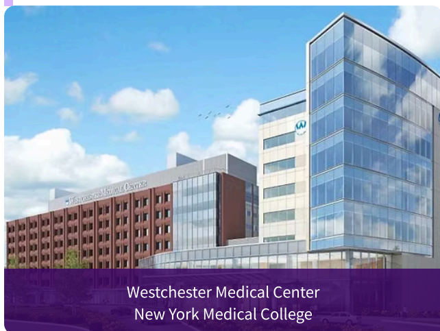
Westchester Medical Center New York Medical College