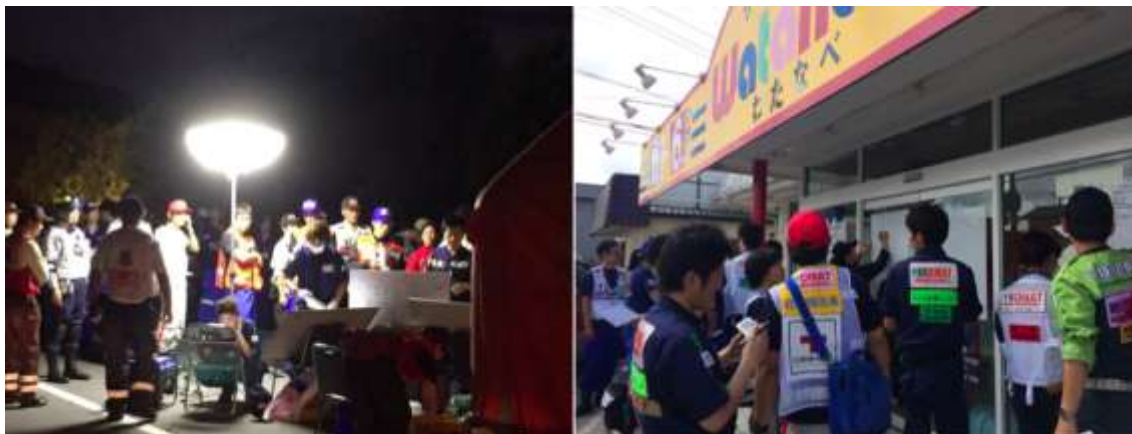
(左:現場救護所搬送拠点にて、右:水海道大橋活動拠点にて)