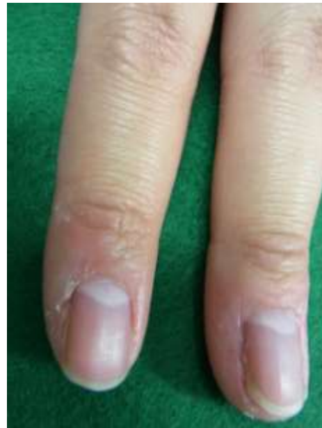
治療後 1 カ月