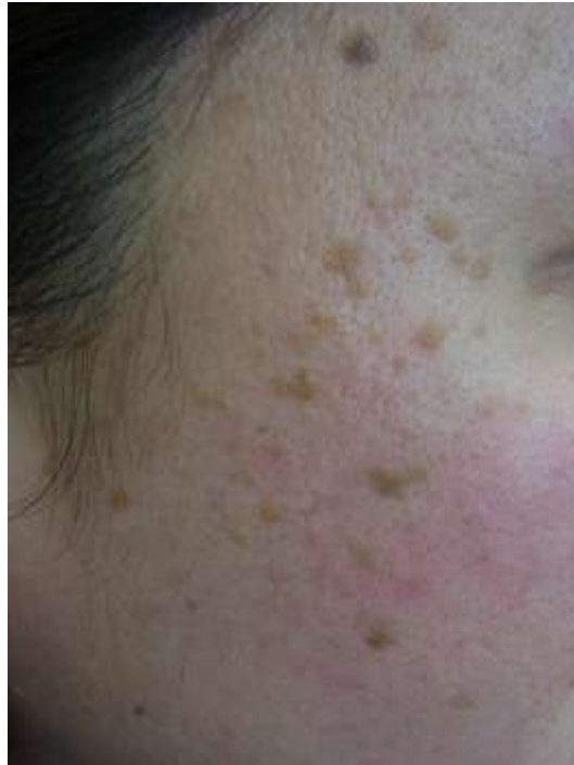
脂漏性角化症 (老人性いぼ)