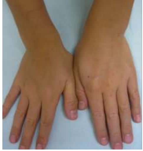
治療後 (6ヶ月で治癒)