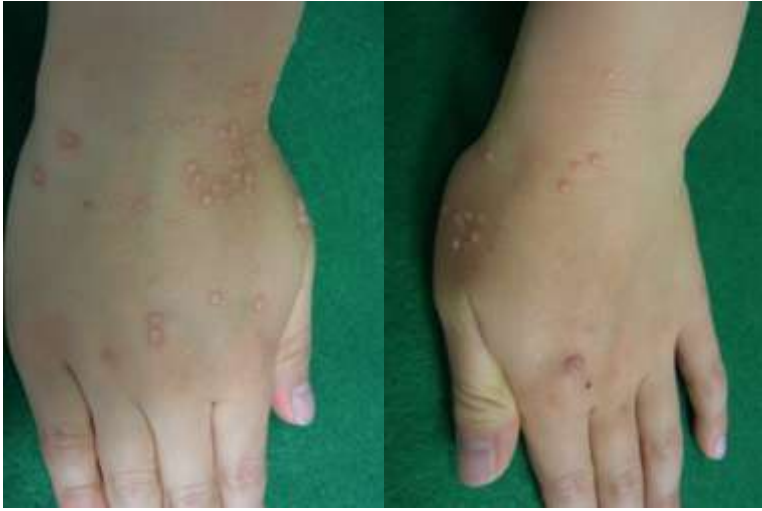
治療前 (7歳、男児。初診の3年前から病悩)