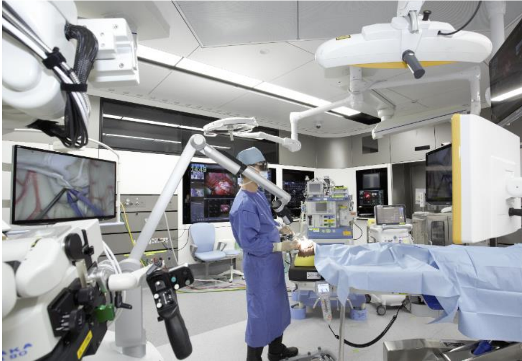
スマート手術室での脳外科手術(イメージ)

データの伝送には、ドコモのクラウドサービス「ドコモオープンイノベーションクラウド」を使用します。これにより手術のデータを高セキュリティに、また大容量データを低遅延 ※4 で伝送することが可能です。スマート治療室内の複数の医療機器データ管理は、医療情報統合プラットフォームの「OPeLiNK(オペリンク) ® 」 ※5 を活用します。