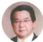
岡野 光夫 (東京女子医科大学 先端生命医学研究所 特任教授)