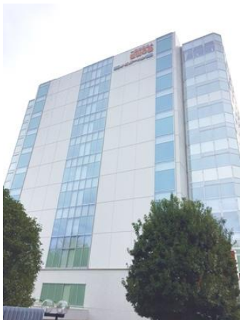
・小金井リハビリテーション病院リハビリテーション科