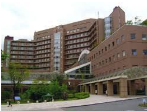
・新東京病院リハビリテーション科