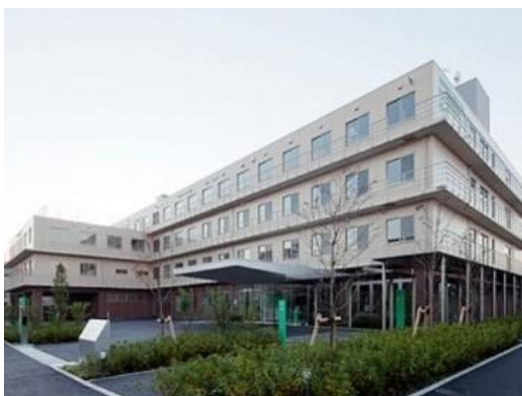
・五反田リハビリテーション病院リハビリテーション科