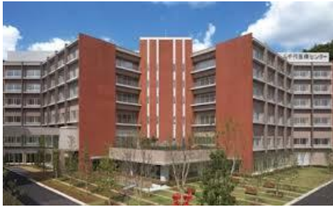
・原宿リハビリテーション病院リハビリテーション科