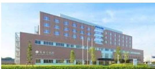
・牧田総合病院蒲田分院リハビリテーション科