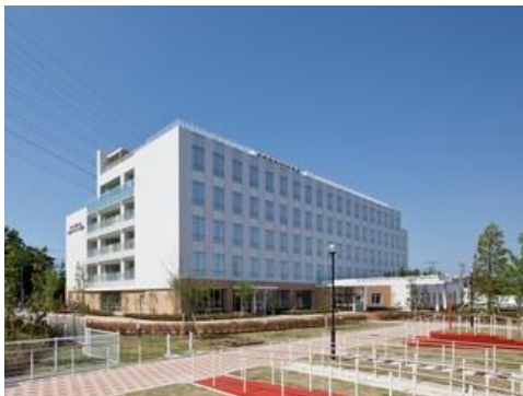
・蒲田リハビリテーション病院リハビリテーション科