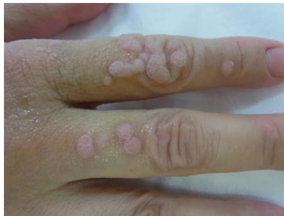
尋常性疣贅の治療前