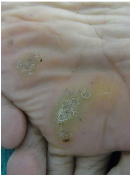
ロングパルスダイレーザー 治療前