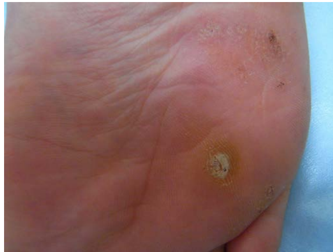
ヨクイニンエキス内服治療中