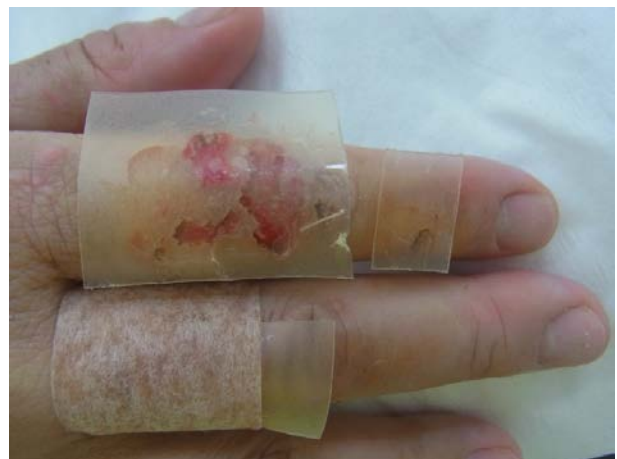
CO 2 レーザー治療直後 閉鎖療法を励行