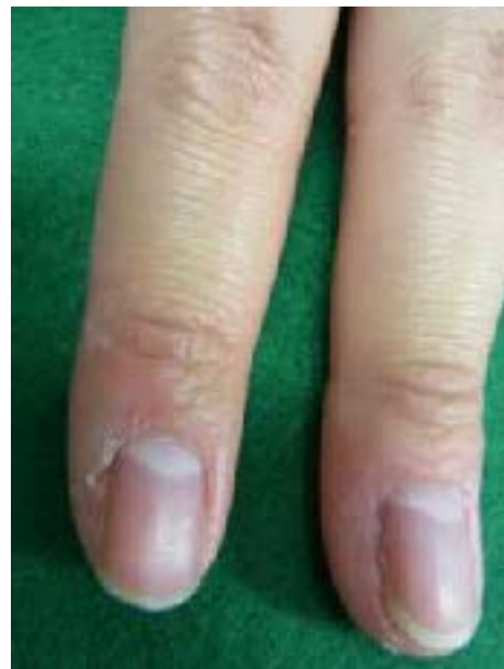
治療後 1 カ月