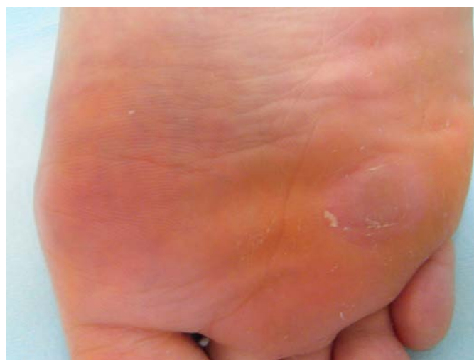
ヨクイニンエキス内服で治癒