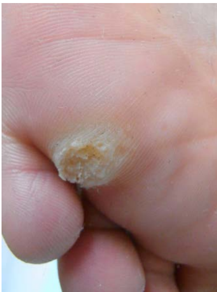
CO 2 レーザー照射前