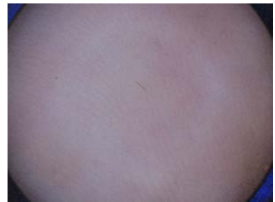
ダーモスコーピーによる 診断で治癒を確認