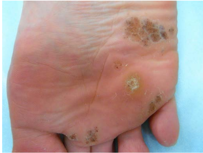
足底疣贅へのヨクイニンエキス内服治療