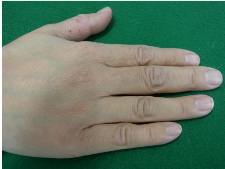
CO 2 レーザー照射後3か月、再発なし。