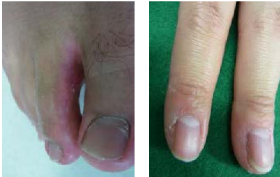
治療後 1 カ月