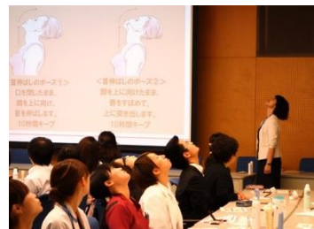
フェース エクササイズ